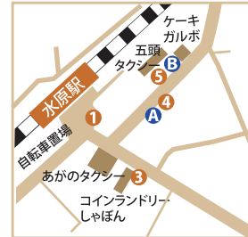
水原駅周辺のバス停

JR羽越線の列車は早朝に集中しているために、午前9時以降の新津回りは12時近くまで列車がありません。そこで、JR水原駅からは、反対回りの新発田経由で新潟駅まで帰ることもできますが、新発田駅での待ち時間は55分です。