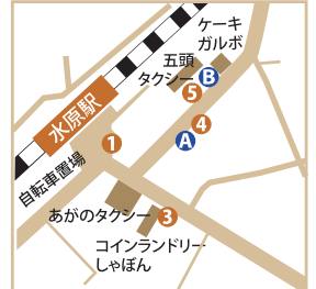
水原駅周辺のバス停

JR羽越線の列車は早朝に集中しているために、午前9時以降の新津回りは12時近くまで列車がありません。そこで、JR水原駅からは、反対回りの新発田経由で新潟駅まで帰ることもできますが、新発田駅での待ち時間は55分です。