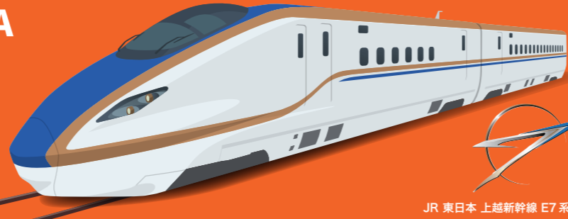
JR 東日本 上越新幹線 E7系 と き

JR TOKYO Station NIIGATA GOZU ONSEN 3 hr 30 min